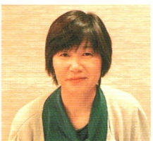
記事 ぽかぽか 出身地：岡山市 以前住んでいた所：倉敷市、東京都 何でも「広く・浅く」がモットー の多趣味人です。

三隅町の「田の浦海岸」にはオートキャ ンプ場があり、海水浴とキャンプを楽 しむための設備が整っています。